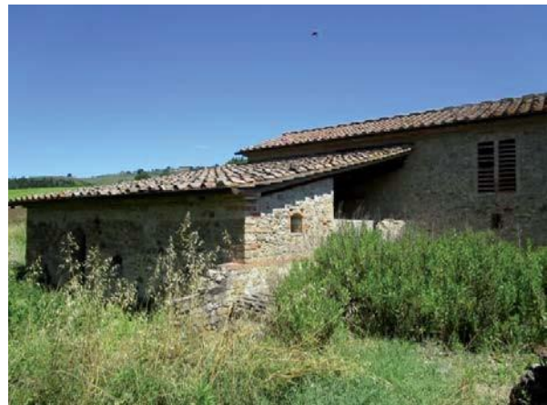
Foto effettuata per l'aggiornamento della scheda in sede di Variante al PS 2016